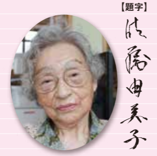
【題字】 藤森 美子