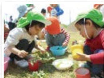
葉っぱのごちそう、作ってます。(2才児)