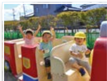
外あそび、だあ〜いすき(1才児)