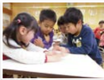
みんな、真剣な顔で何の話してるの〜?