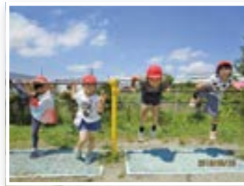
てつぼうにチャレンジ!!