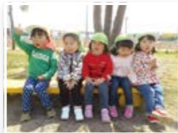
みんなてひなたぼっこ!(2才児)

平成16年4月より、生後6か月〜2歳までの定員90名の保育園として開設しました。ゆったりとした環境の中で、一人一人の思いや育ちを大切に、園庭で遊んだり、近くの広場や公園に出かけて自然にふれる保育を多く取り入れ、感性豊かにのびのびと遊び、地域の方々とのふれあいも大切にしています。