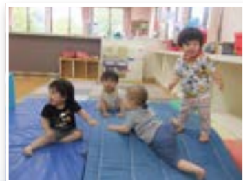
マットの山、のぼるの楽しいな(0才児)