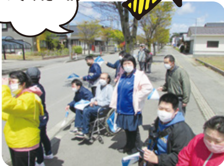
山形県縦断駅伝を応援