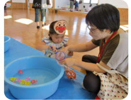
ママと一緒にきんぎょすくい♡