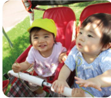
藤の花のつる 初めて触ったよ(0歳児)

新型コロナウイルス感染症が5類に移行したことで、今年のくりくりまつりは保護者2名での参加に緩和されました。お家の方と一緒に子ども達もとても嬉しそうでしたよ。