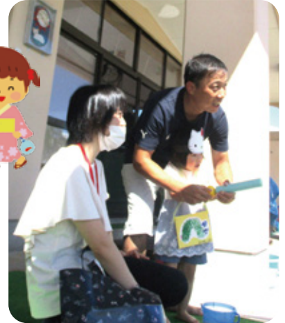
パパと一緒に的をめがけて、シュッ～