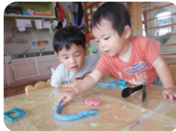
小麦粉粘土のへビ ニョロニョロ～(1歳児)