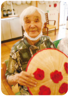
夏花笠音頭を楽しく踊りました

新型コロナウイルスが5類になり、今年から保育園との交流も再開しました。今後も感染対策を徹底し、ご利用者様に楽しんで頂けるような行事を考えていきます。