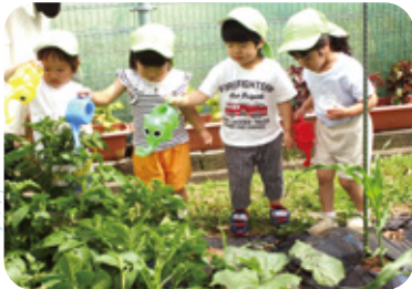
じゃがいも大きくな～れ(2歳児)