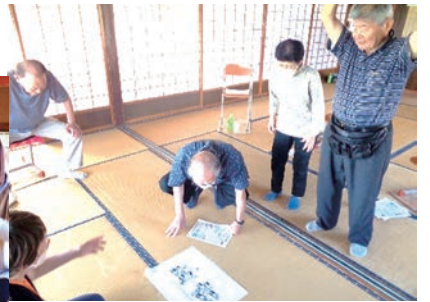
少人数でも楽しく♪